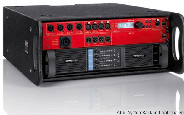
Abb. SystemRack mit optionalen RackRahmen

Der Vorteil des K&F SytemRacks* liegt auf der Hand, schnelles und intuitives Arbeiten. Mit wenigen Handgriffen steht die Basis für kreatives Arbeiten zur Verfügung. Dies ist unser Beitrag für alle die sich dem guten Ton verschrieben haben. Ganz im Sinne der Kling & Freitag Philosophie.